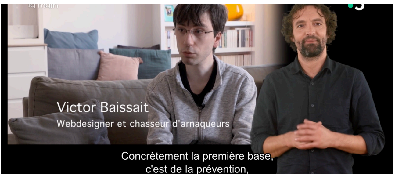
L'œil et la main: Trop beau pour être vrai, France 5, 30 janvier 2023