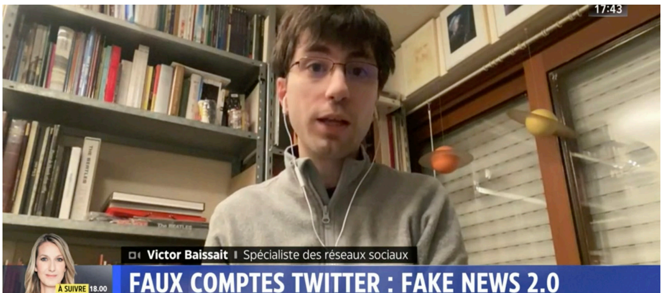
Anti-complot, sujet sur les faux comptes Twitter: Fake news 2.0, LCI [Direct], 03 décembre 2021